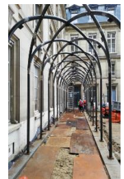
Pose de la marquise

A noter, deux derniers mois avec une forte nuisance sonore extérieure.